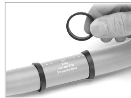
Bild 1: Centerring Demontage Wenn diese Lenker in einem „konventionellen“ Vorbau verwendet werden, müssen die beiden aufgespressten Kunststoff Zentrierringe in der Lenkermitte abgestreift werden. Legen Sie einen Lappen um die Ringe, dann den Lappen greifen und den Lenker kräftig gegen den Boden drücken. Gegen Kratzer evtl. ein Handtuch o.ä. zwischen Lenker und Boden legen.